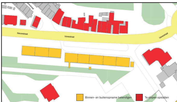
Plattegrond: sloopplan VSM Sloopwerken

Voorafgaande aan de sloop wordt er een bouwkundig vooronderzoek uitgevoerd door Vermeer Expertise wat bestaat uit een binnen- en buitenopname van geselecteerde panden. Dit vindt plaats op 9 en 10 oktober a.s. en de bewoners/gebruikers van deze panden krijgen hierover een brief.